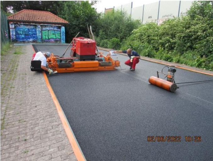
Oberschicht: EPDM-Granulat und Polyurethan aufgespritzt, Farbe: Ziegelrot