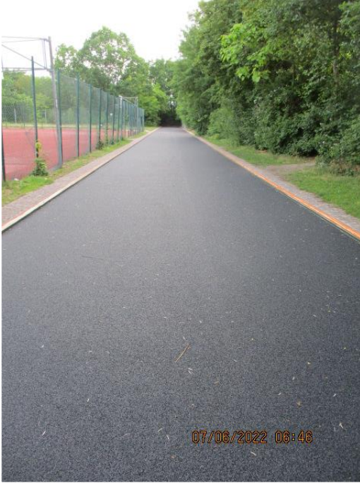
Kunststoffbelag auf bituminös- gebundener Tragschicht