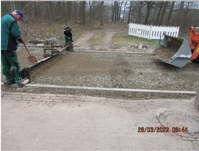
Herstellung des Planums