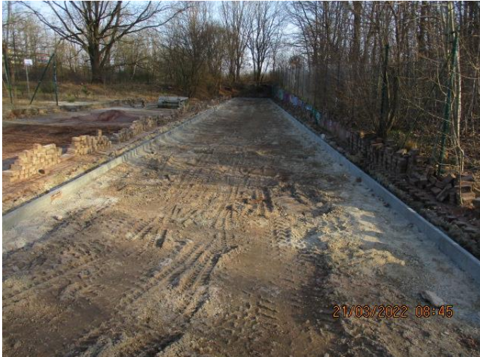
Herstellung des Unterbaus