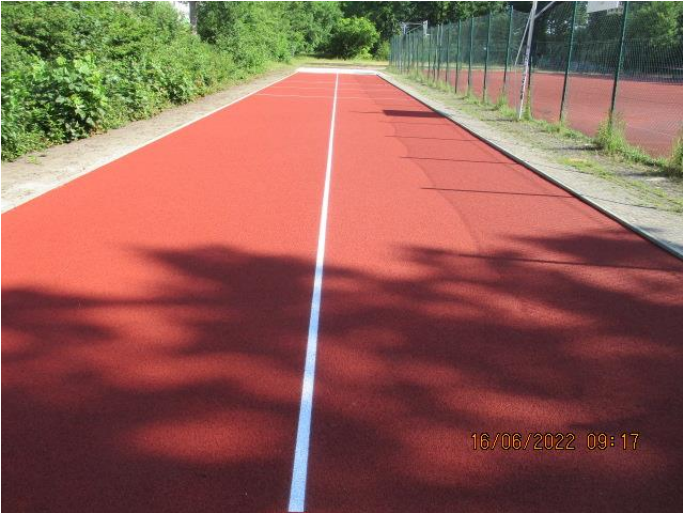
Linierung für Lauf- und Anlaufbahnen